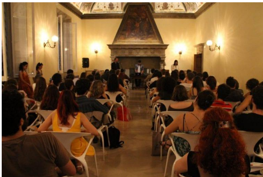
Oven 2018 - Palazzo Boncompagni

Lo scopo del festival Oven è quello di donare alla città un momento di alta concentrazione culturale e di costituire un polo geografico di riferimento per la poesia nazionale e internazionale. Dopo aver incluso nelle scorse edizioni nomi del calibro di Maurizio Cucchi, Giampiero Neri, Peter Handke, Homero Aridjis, Richard Harrison, e Cees Noteboom, anche il programma di quest'anno comprenderà alcuni dei più importanti poeti del panorama italiano e straniero.